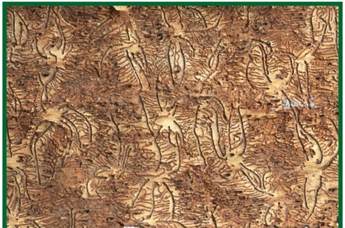
Požerky lýkožrouta lesklého

K odchytům lýkožrouta lesklého jsou vhodné nárazové typy lapačů (šterbinové lapače typu Theysohn nebo křížové lapače typu Ecotrap). Sítko ve šterbinách kontejnerů musí být dostatečně husté, aby nedocházelo