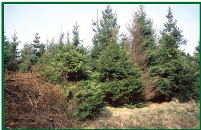
Odstraňování těžebního odpadu je základním preventivním opatřením proti lýkožroutu smrkovému; vpravo na obrázku smrková souše po napadení l. lesklým

k unikání zachycených jedinců. K navnazení se používají odparníky určené k lákání tohoto druhu, které jsou uvedeny v „Seznamu povolených přípravků na ochranu rostlin“, který vydává Ministerstvo zemědělství ČR ve spolupráci se Státní rostlinolékařskou správou Brno, nebo v „Seznamu povolených přípravků na ochranu lesa“, sestavovaného pracovníky VÚLHM Jíloviště-Strnady (tento seznam kopíruje a pro praxi doplňuje výše uvedený seznam), a to podle platných etiket (dále jen „Seznam“). Odparníky se vyvěšují těsně před předpokládaným začátkem rojení, tj. v nižších polohách zpravidla v druhé polovině dubna, ve vyšších polohách poněkud později.